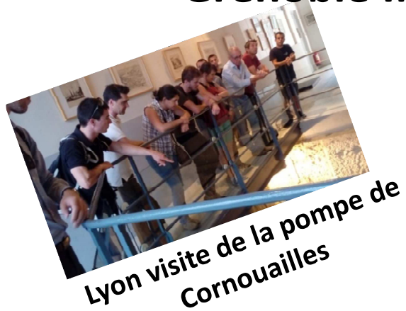
Lyon visite de la pompe de Cornouailles