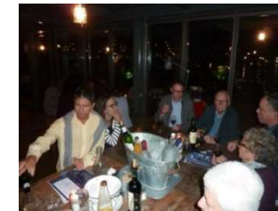
Assemblée générale du groupement Aquitaine