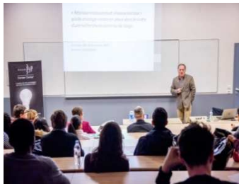
Dauphiné semaine du mentorat