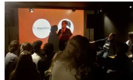
Paris afterwork spécial Start'Up