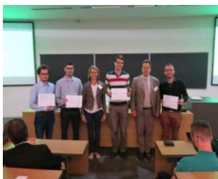
Remise des prix PFE à l'Ense3