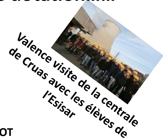
Valence visite de la centrale de Cruas avec les élèves de l'Esisar