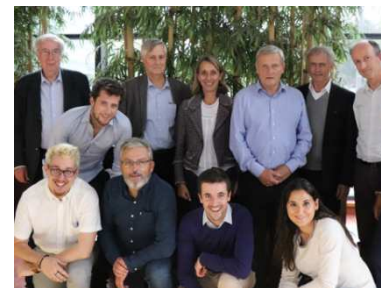
Une équipe renouvelée