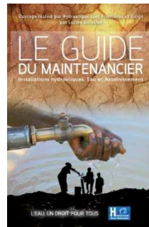
Participation à l'édition du guide du maintenancier publié par Hydraulique sans Frontières