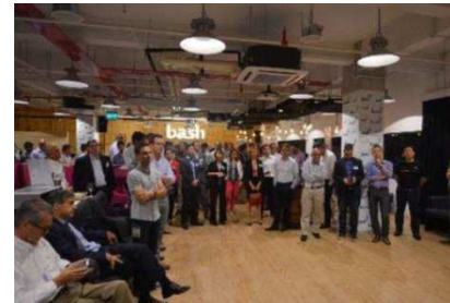
Singapour Rencontre entre diplômés grenoblois à l'occasion du salon IOT (objets connectés)